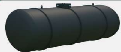
SEWAGE COLLECTION TANK