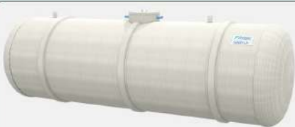
PACKAGED STP (B & G WATER)