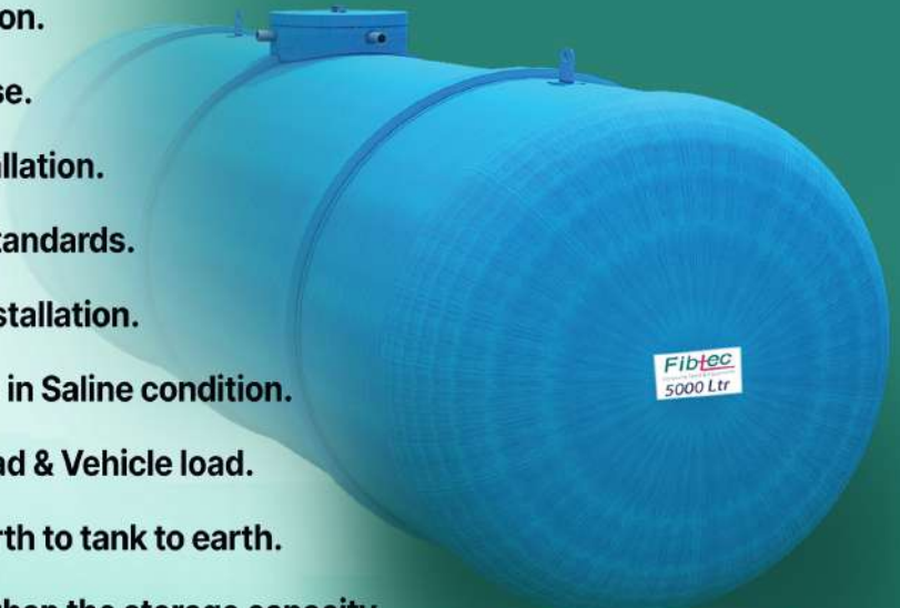
WATER STORAGE (SUMP) TANK